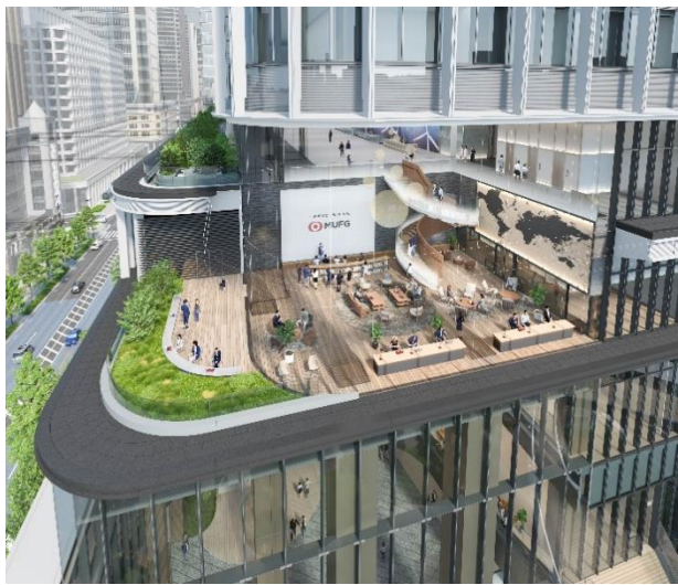
(4階 ラウンジスペース・共創空間)