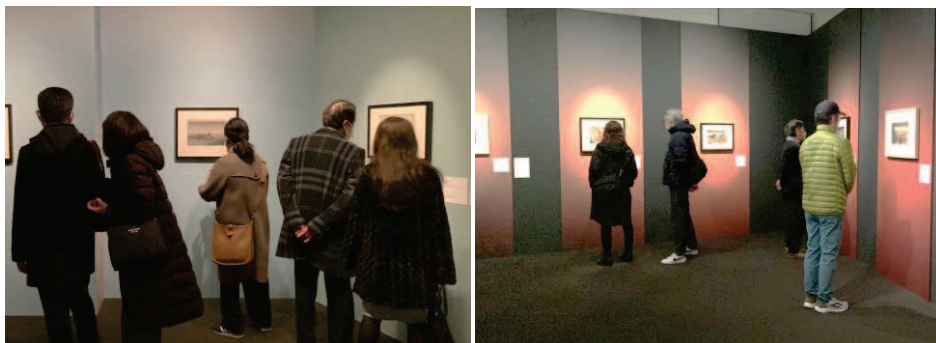
▼イベント中の様子